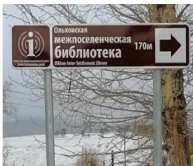
Рисунок 3. Знаки туристической навигации – ТИЦ в библиотеках