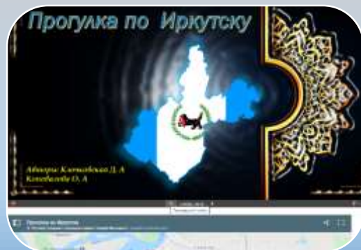
«Прогулка по Иркутску» - путеводитель.

Сначала скачать файл затем открыть для просмотра