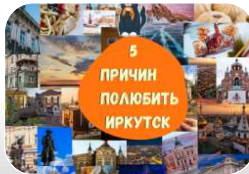
«5 причин полюбить Иркутск» - путеводитель