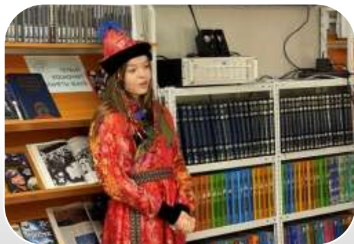
«Дворец Бичиханова» - фильм-экскурсия